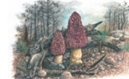
Morchella esculenta "Colmenilla"