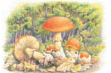
Amanita caesarea "Oronja"