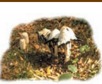
Coprinus comatus "Barbuda"