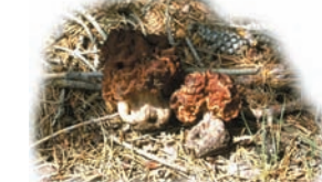
Gyromitra esculenta "Cagarria"