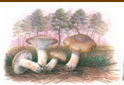
Hygrophorus spp. "Llanega"