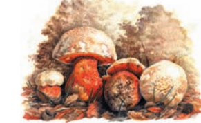
Boletus satanas "Boletto de Satanás"