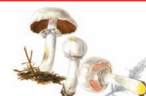
Agaricus xanthoderma "Champiñón amarillento"