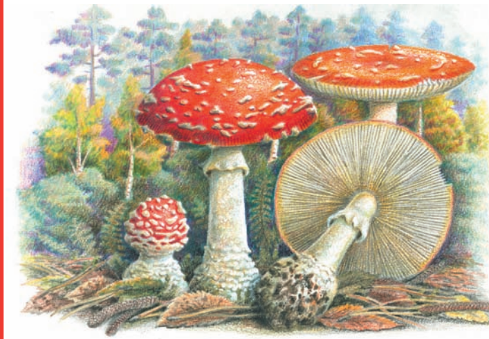
Amanita muscaria "Falsa Oronja, Matamoscas"

ÉPOCA: otoño (O), invierno (I), primavera (P), verano (V). HÁBITAT: claros bosque (Cl), frondosas (Fr), erial (Er), pinar (P), prado (Pr), pastizal (Pz) y ribera (Ri).