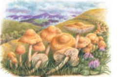
Marasmius oreades "Senderilla"