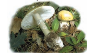
Amanita phalloides "Cicuta verde, Oronja mortal"