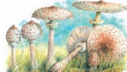
Macrolepiota procera "Parasol"