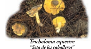
Tricholoma equestre "Seta de los caballeros"