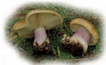
Lepista personata "Pie violeta"