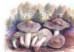
Tricholoma terreum "Ratón, Negrilla"