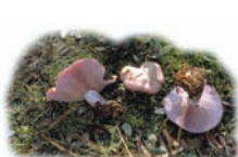
Lepista nuda "Pie azul"