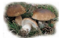
Boletus edulis "Hongo, Boletto blanco, Miguel"