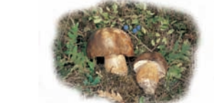
Boletus aereus "Hongo, Boletto negro"