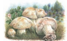
Calocybe gambosa "Lansarón, Perrechico"