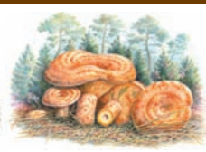
Lactarius deliciosus "Niscalco, Nicola, Rovellón"