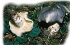
Tricholoma portentosum "Capuchina"