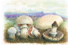
Agaricus spp. "Champiñón silvestre"

ÉPOCA: otoño (O), invierno (I), primavera (P), verano (V). HÁBITAT: claros bosque (Cl), frondosas (Fr), erial (Er), pinar (P), prado (Pr), pastizal (Pz) y ribera (Ri).