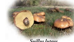
Suillus luteus "Baboso"