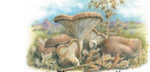
Pleurotus eryngii "Seta de cardo"